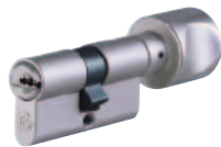
Cylindre à bouton profilé n° 815 WSM Laiton nickelé mat Peut être vendu avec diverses formes de bouton (la forme H est représentée)