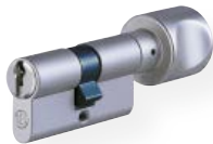
Cilindro con pomolo art. no. 815 PSM Cilindro con gambo pomolo art. no. 815/130 PSM Ottone lucido nickel satinato Pomolo in alluminio tipo H (in foto); Altre forme disponibili a richiesta