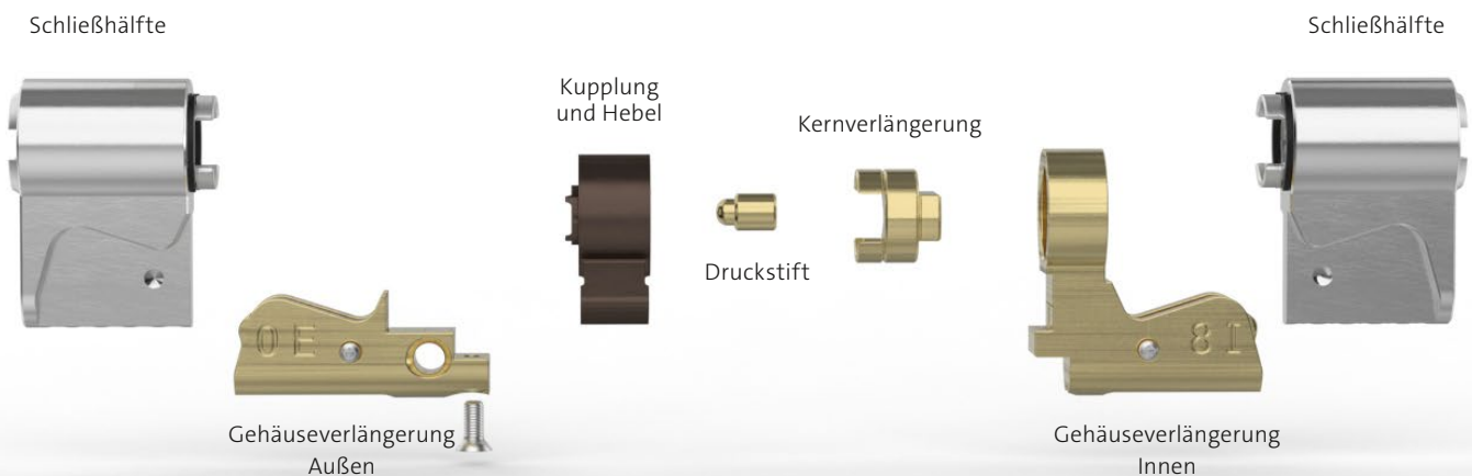
Abbildung zeigt einen Doppelzylinder 812MO + MOKI-08-00 mit der Abmessung 35,5 (Innen) / 27,5 mm (Außen)