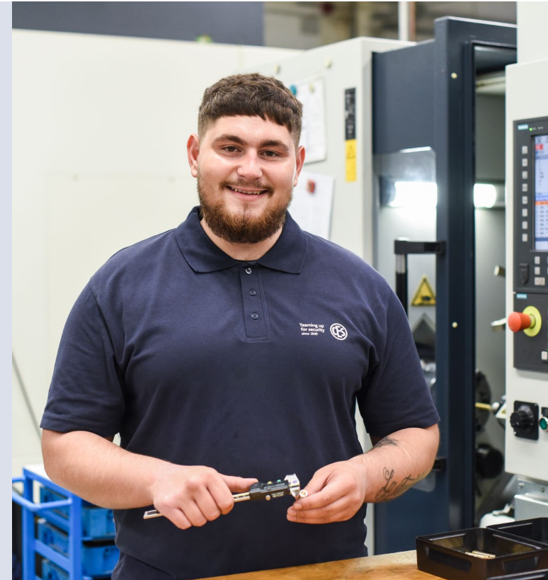
Stand: V 4.0 · DE · 01.2023

Damit unsere Kundschaft immer die bestmögliche Zutrittslösung erhalten, brauchen wir qualifizierte Mitarbeitende. Zurzeit bilden wir 30 junge Menschen zu Fach- und Führungspersonal in kaufmännischen und technischen Berufen aus, auch im Rahmen von dualen Studiengängen. Unsere Auszubildenden arbeiten von Anfang an in den Teams mit, lernen alle Abteilungen im Hause kennen und haben immer einen persönlichen Ansprechpartner. Wichtig ist uns neben der Vermittlung von zukunftsorientiertem Fachwissen auch der menschliche Faktor und die soziale Kompetenz. Und: Für gute Abschlüsse bieten wir nicht nur Prämien, sondern auch die Chance auf einen sicheren Arbeitsplatz.