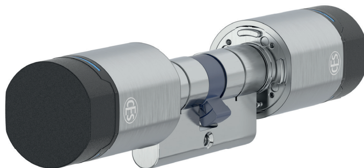
EB8710 Cylindre européen