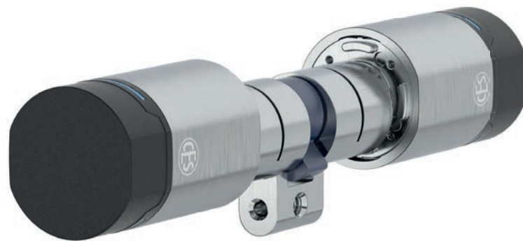
EB6710 Schweizer Rundzylinder