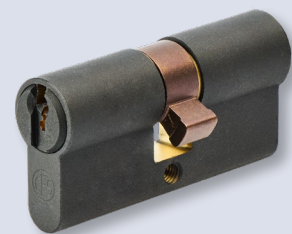
Vielfalt an Zylinderfärbungen