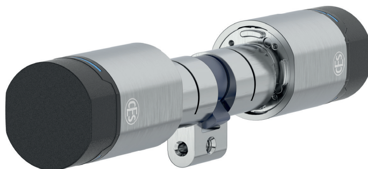
EB6710 Zwitserse ronde cilinder