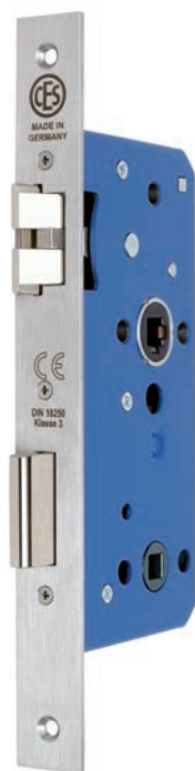
Artikel Nummer 9000WC