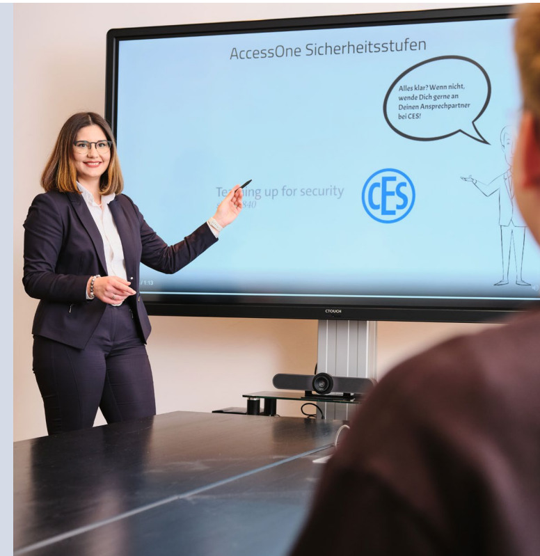
Stand: V 6.0 · DE · 01.2023

Friedrichstraße 243 D-42551 Velbert Tel. +49 (0) 2051-204-0 Fax +49 (0) 2051-204-229 Mail info@ces.eu www.ces.eu