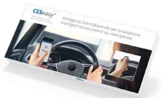
CESeasy Starter-Set Steuerung