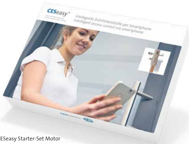
CESeasy Starter-Set Motor