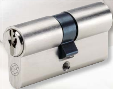
Sicherheits-Profilzylinder 8710 WSZ

Für den CES Profilzylinder 8710 WSZ sind weitere Bauformen erhältlich. So können mit einem Schlüssel nicht nur die Haustür, sondern auch Briefkasten, Garagentor und andere Zugänge verschlossen werden.