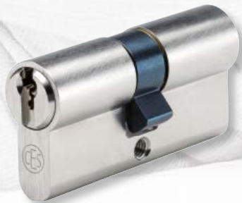
Sicherheits-Profilzylinder 8710 KSZ

Für den CES Profilzylinder 8710 KSZ sind weitere Bauformen erhältlich. So können mit einem Schlüssel nicht nur die Haustür, sondern auch Briefkasten, Garagentor und andere Zugänge verschlossen werden.