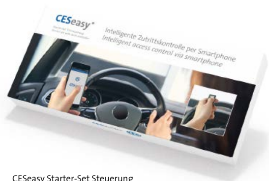
CESeasy Starter-Set Steuerung