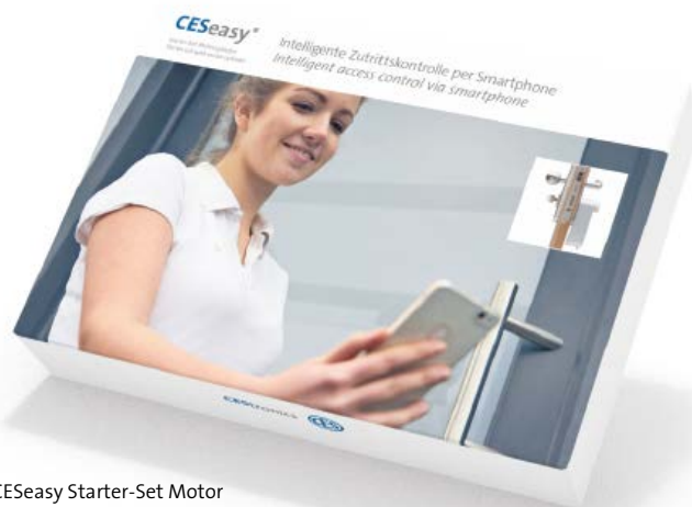
CESeasy Starter-Set Motor