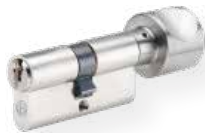
Cilindro pomo no. 815 PSM Latón, níquel mate Cierre por un lado Otro lado con pomo de aluminio, en NF, Disponibilidad de diferentes formas de pomos (la fotografía muestra la forma H)