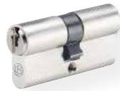
Doble cilindro no. 810 PSM Latón, níquel mate