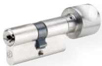
Cilindro pomo no. 815 WSM Latón, níquel mate Cierre por un lado Otro lado con pomo de aluminio, en F1, Disponibilidad de diferentes formas de pomos ( la fotografía muestra la forma H )