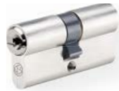
Doble cilindro no. 810 WSM Latón, níquel mate