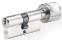
Cilindro pomo no. 815 PSM Latón, níquel mate Cierre por un lado Otro lado con pomo de aluminio, en F1, Disponibilidad de diferentes formas de pomos ( la fotografía muestra la forma H )