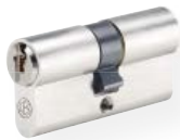
Cylindre double entrée profilée n° 810 PSM Laiton nickelé mat