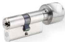
Cilindro con pomolo art.no. 815 WSM Cilindro con gambo pomolo art. No. 815/130 Ottone opaco nichelato su un lato la funzione di chiusura, sull'altro lato pomolo in alluminio, NF, pomolo disponibile in diverse forme (nella figura forma H)