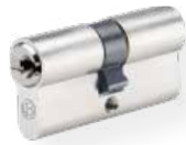
Doppio cilindro art. no. 810 WSM Ottone lucido, nickel satinato